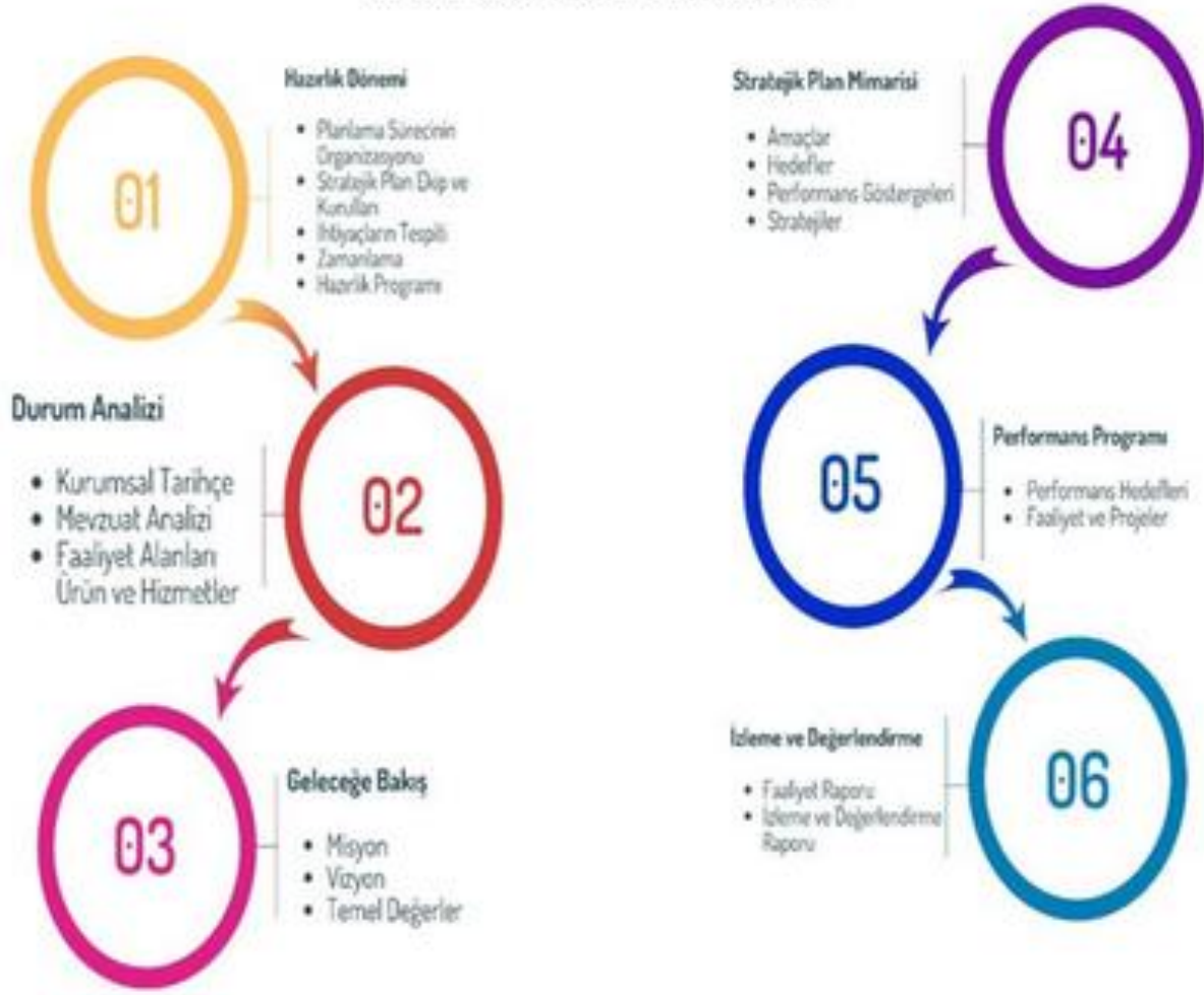
Şekil 1.3: Stratejik Planlama Modeli

Başarılı bir stratejik planlamanın önemli adımları arasında plan hazırlık çalışmalarının belli bir sistematik yapı içerisinde yürütülmesi ve hazırlık sürecinde katılımcılığın yüksek düzeyde olması ile ekip çalışmasının sağlıklı bir şekilde gerçekleşmesi yer almaktadır. Hazırlık Programı'nın yayımlanmasının ardından Strateji Geliştirme Kurulu ve Stratejik Planlama Ekibi oluşturulmuştur.