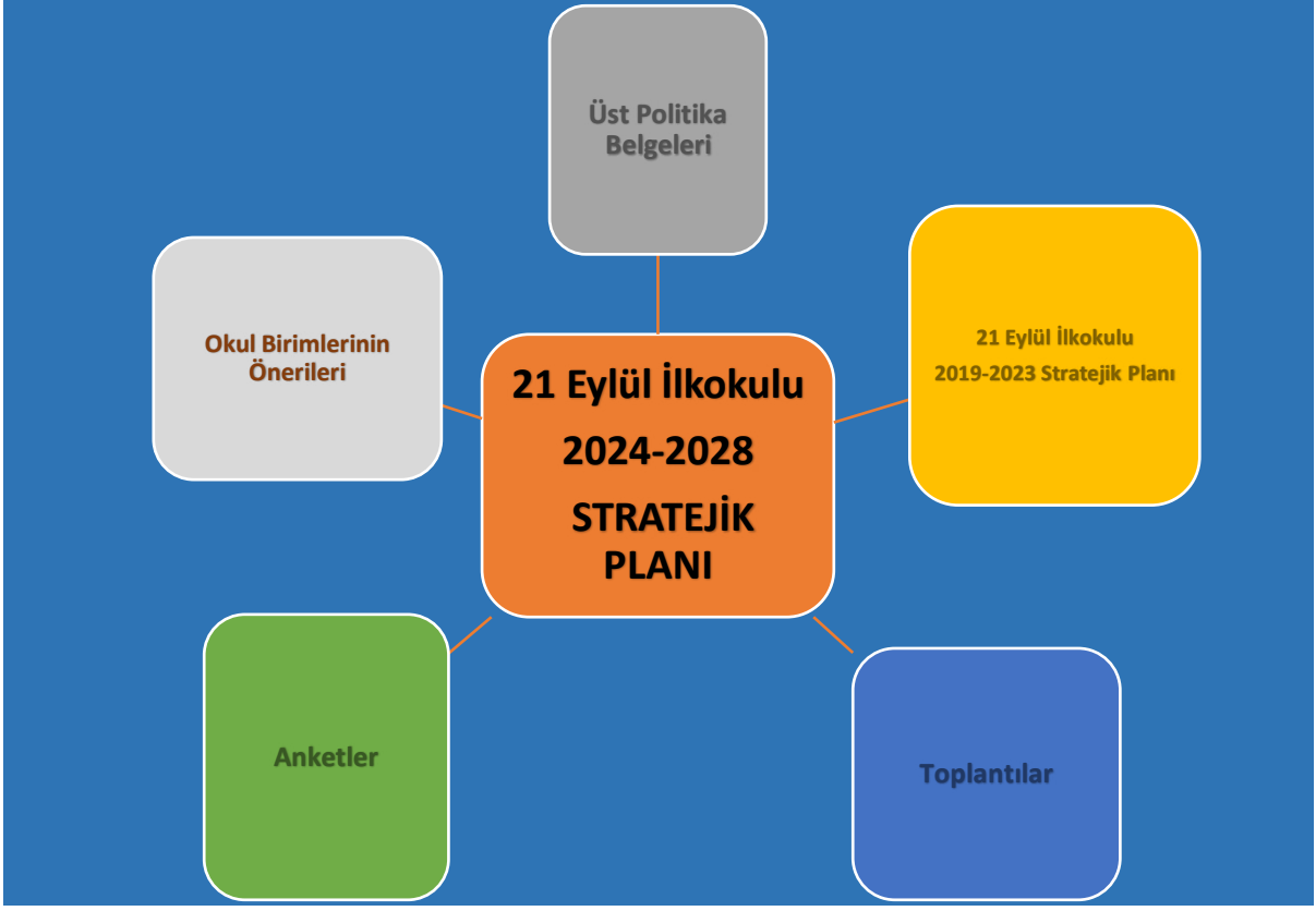
Şekil 1.2: Stratejik Plan Oluşum Şeması

Stratejik plan hazırlık çalışmalarının başladığı, Bakanlık tarafından taşra birimlerine 2022/21 sayılı Genelge ile duyurulmuştur. Genelgede stratejik yönetim anlayışının öneminden bahsedilmiş, MEB'in 2010-2014, 2015-2019 ve 2019-2023 Stratejik Planları ile gösterdiği gelişim üzerinde durulmuş, taşra teşkilatında bugüne kadar stratejik yönetim felsefesinin benimsenmesi ve kabiliyetinin geliştirilmesi konusunda gerçekleştirilenler özetlenmiştir. Genelge doğrultusunda Ayvacık Millî Eğitim Müdürlüğü 2024–2028 Stratejik Planı, literatür taraması, üst politika belgelerinin analizi, çalıştaylar, iç ve dış paydaşların görüşlerinin katkılarıyla hazırlanmıştır.