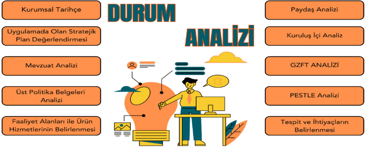
Şekil 2: Durum Analizi Şeması

Bakanlığın geleceğe yönelik amaç, hedef ve stratejiler geliştirebilmesi ve karar alma süreçlerine rehberlik edebilmesi için mevcut durumda hangi kaynaklara sahip olduğu, geçmiş dönemlerdeki başarıları, hangi alanlarda hedeflerine ulaşmış, ulaşmamış ise bunların nedenleri, hangi yönlerinin gelişmeye açık olduğu, kontrolü dışındaki olumlu ya da olumsuz gelişmelerin neler olduğunun değerlendirildiği durum analizi bölümünde; Müdürlüğümüzün tarihçesi, mevzuat analizi, faaliyet alanları, paydaş analizleri doğrultusunda çalışmalara yer verilmiştir. Durum analizinde, kuruluşun yasal yükümlülükleri çerçevesinde yürüttüğü faaliyetler ve sunduğu hizmetler ortaya konmuştur. Müdürlüğümüz birimlerinin sundukları hizmetler, hizmet çeşitleri ve hizmetlerden yararlanan paydaşlara ilişkin çalışmalar gerçekleştirilmiştir. Kurum içi ve dışı paydaş analizleri yapılmıştır. GZFT analizinde iç paydaşların görüşlerine ağırlık verecek ve kurum içi katılımı en üst seviyede sağlayacak şekilde çevrim içi anketler kullanılmıştır. Birimlerle yapılan toplantılarda birimlerin güçlü ve zayıf yönleri, fırsat ve tehditleri önceliklendirilmiştir. Birim bazında oluşturulan GZFT analizleri Stratejik Plan Ekibi tarafından düzenlenerek kurumsal GZFT analizi yapılmıştır.